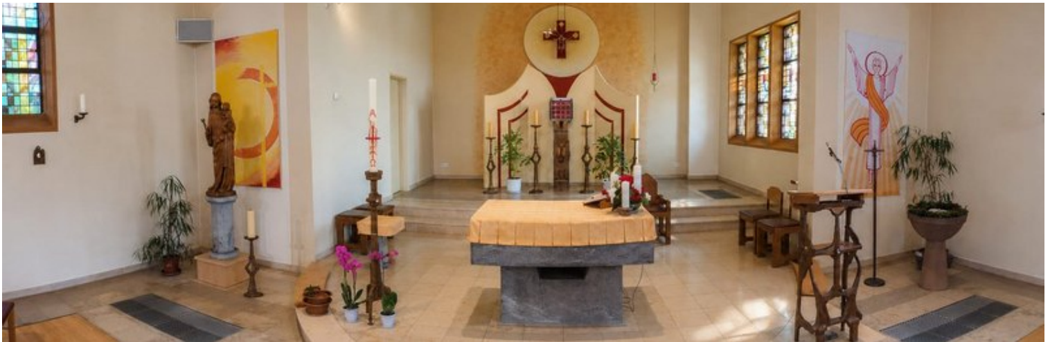
St. Peter und Paul